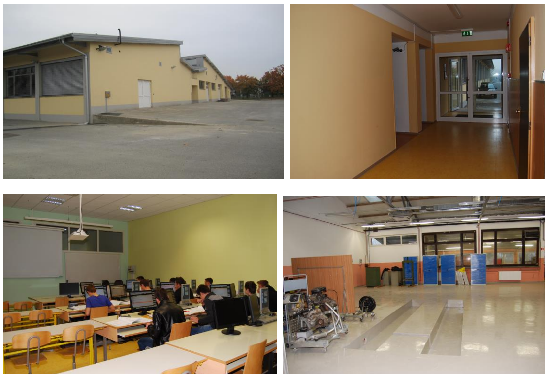
Slika 1: Prikaz ureditve MIC